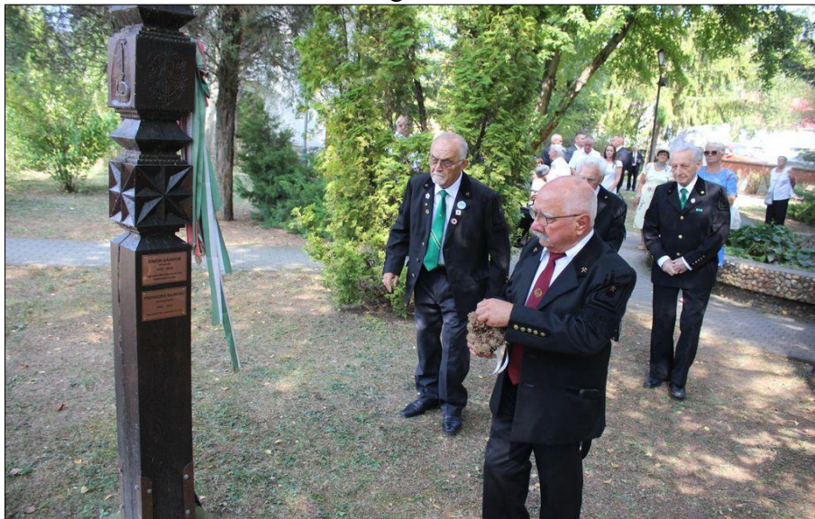
Egercsehi nyugdíjas bányászok

A Bánya- Energia- és Ipari Dolgozók Szakszervezete megkeresésére az államkincstár közölte, az Energiaügyi Minisztériumtól kapott tájékoztatás szerint a nyugdíjas bányászok szénjárandóságának pénzbeli megváltásának éves összege idén 118 ezer 195 forint. A juttatás még jó pár ezer, tízezer embert érinthet országosan.